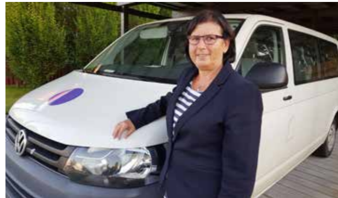
▲ De MiMobus in Zuurhage.

We vonden vrijwillige chauffeurs en zelfs een vriendelijk dame