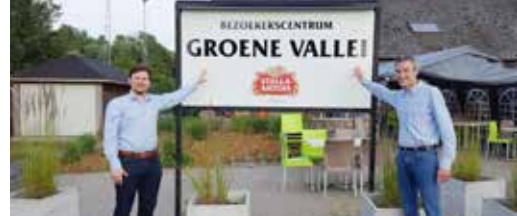
N-VA zet in op 'Groene Vallei' p. 3