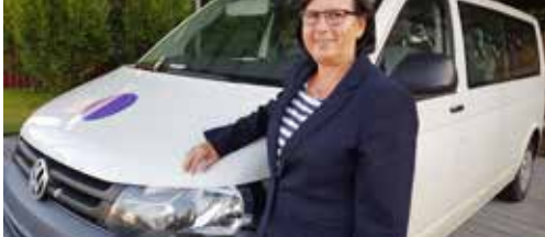
Belbus wordt MiMobus p. 2