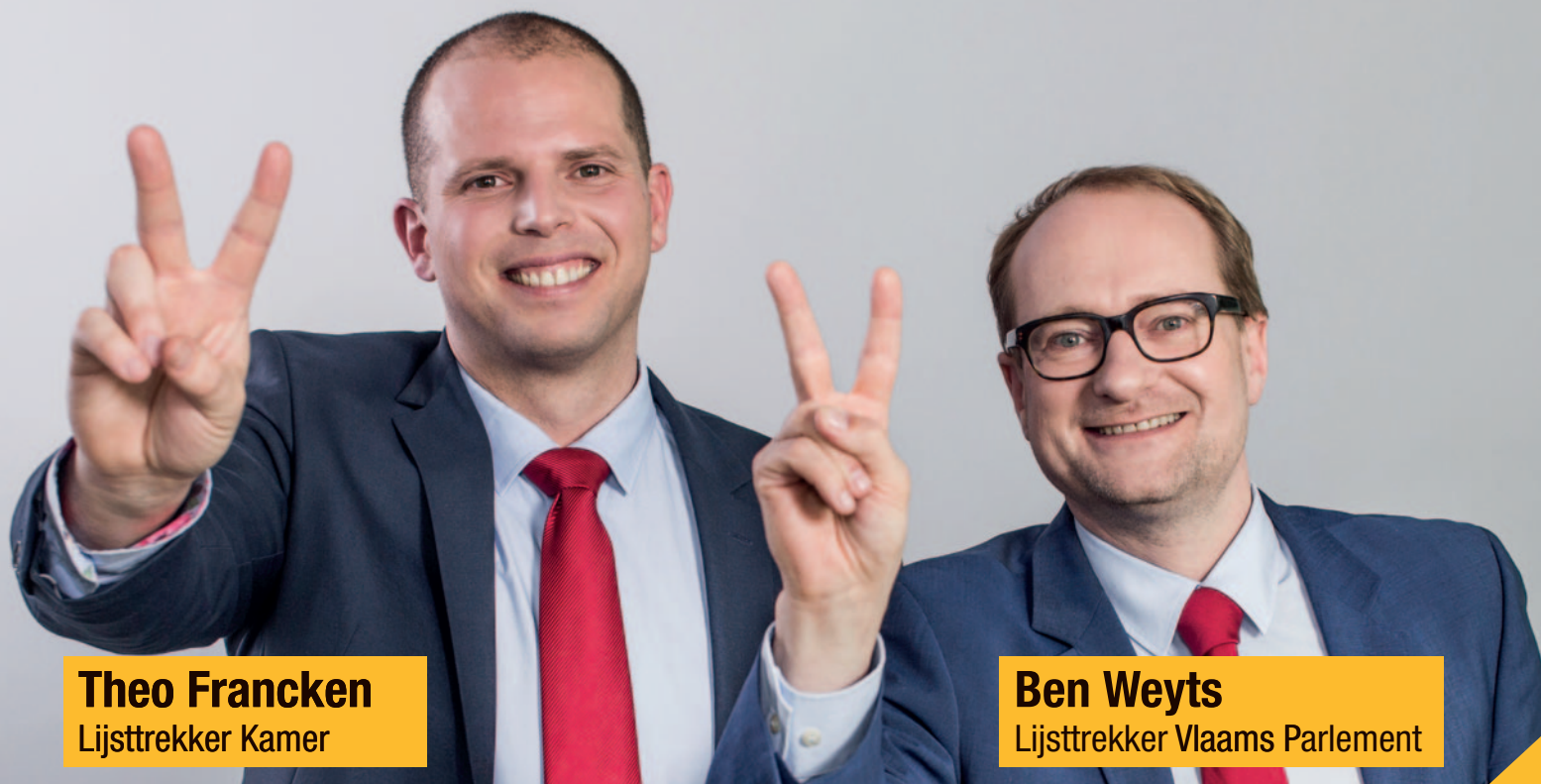
Theo Francken Lijsttrekker Kamer