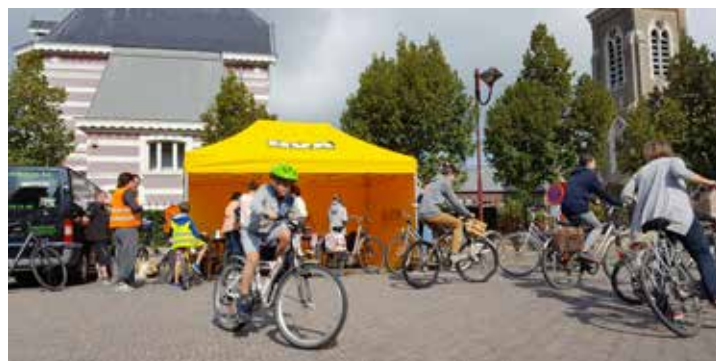
▲ De fiets- en wandeltocht Hapje-Trapje-Stapje was opnieuw een succes!

Door de hevige regenval in mei en juni, hebben zij een deel van de opbrengst verloren zien gaan. Daarom hebben wij, net als verschillende andere gemeenten, succesvol actie ondernomen. De Vlaamse regering erkent dit nu officieel als ramp. Daarom wil ik onze schepenen, raadsleden en bestuursleden