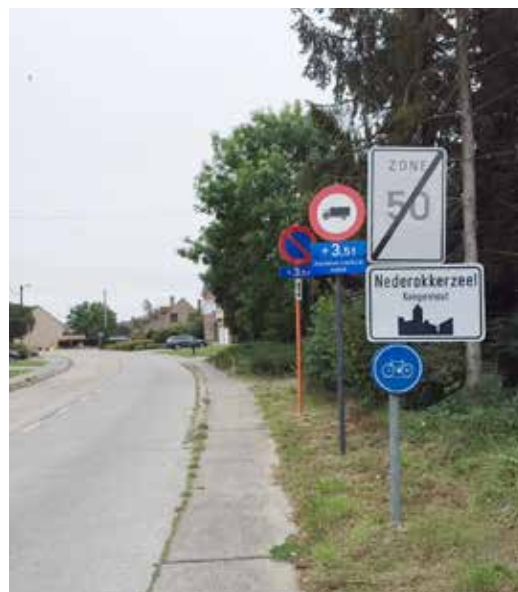
▲ Doorgaand zwaar verkeer moet voortaan langs de N-wegen rijden.