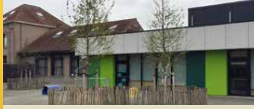
Speelbos en groenere speelplaats voor Toverberg (p. 2)