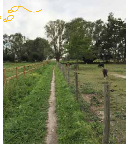
▲ Trage wegen vormen veilige verbindingen voor de zwakke weggebruiker.

N-VA Kampenhout pleit ervoor om het tragewegennetwerk verder te versterken. De trage wegen vormen namelijk zeer veilige verbindingen voor de zwakke weggebruikers.