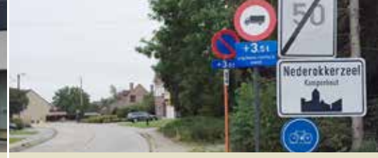
Verbod op zwaar verkeer in Nederokkerzeel (p. 3)